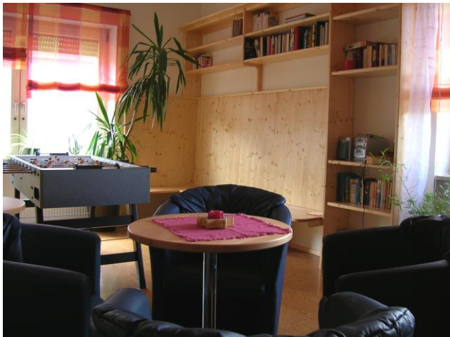
Wohnraum einer Schülerwohngruppe

„Adler“: 8 Plätze für Mädchen und Jungen Aufnahmealter: 6 bis 12 Jahre